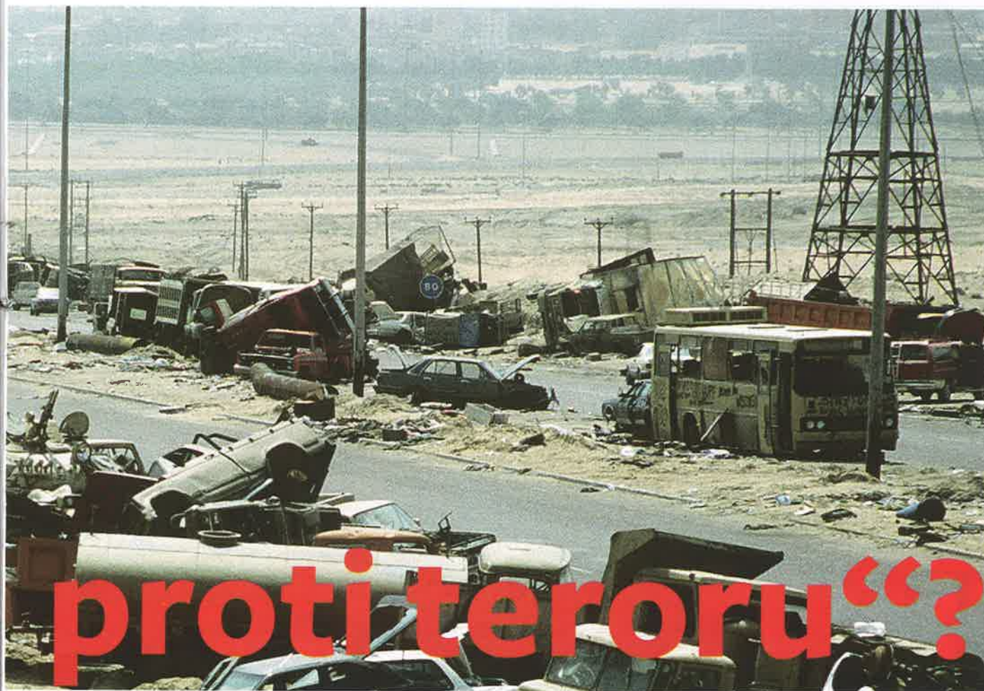
Takto vypadá válka, konkrétně v Iráku v dubnu 1991. Moc se od té doby nezměnilo.