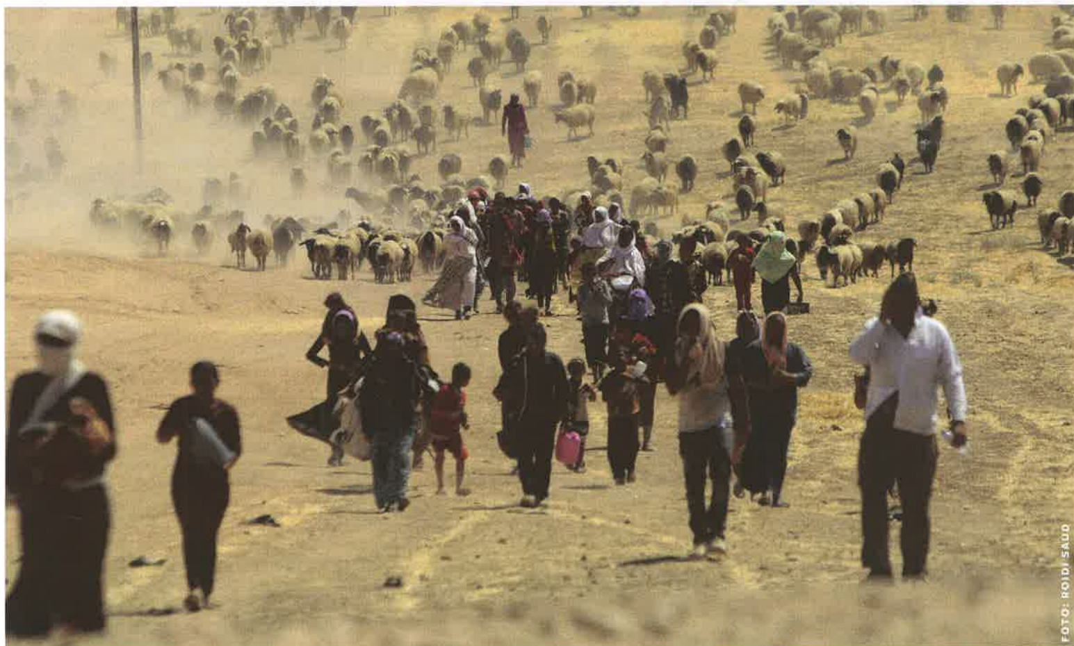
Prchající jezidové před jednotkami Islámského státu