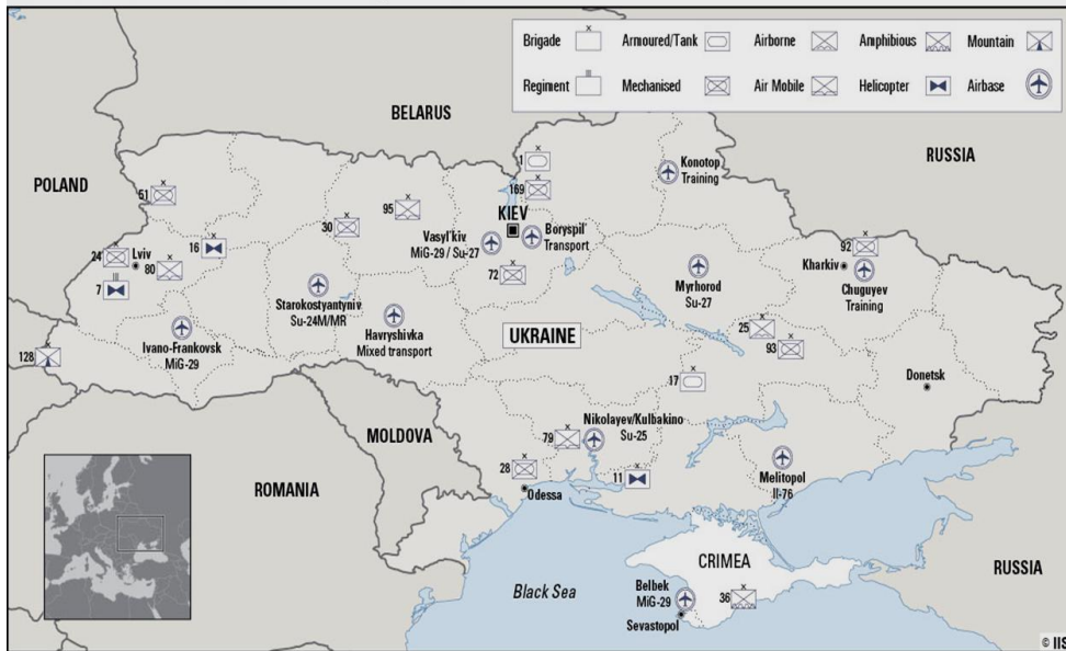
Ukraine: Main land and air force dispositions