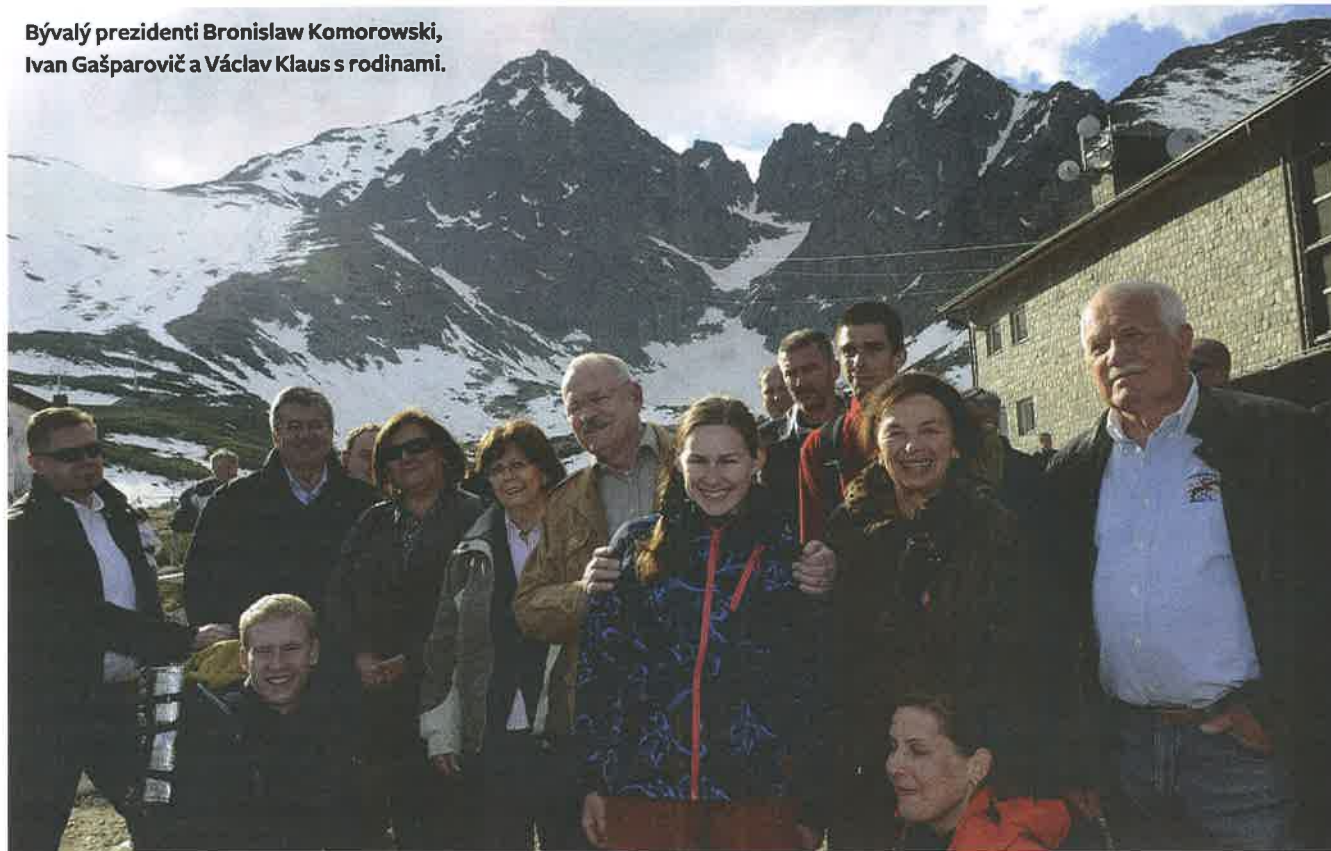
Bývalý prezident Bronislaw Komorowski, Ivan Gašparovič a Václav Klaus s rodinami.